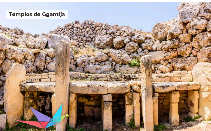
Templos de Ggantija

Desayuno en el hotel y salida desde este para visitar la zona conocida como Las Tres Ciudades: Vittoriosa, Cospicua y Senglea. Pasando por Cospicua en autocar se llega a Birgu o Victoriosa como se llama hoy. Pasearemos por sus bellas callejuelas estrechas a la sombra de sus edificios históricos, incluidos los primeros albergues en diferentes idiomas en los que se dividió la Orden de los Caballeros. Es aquí donde los Caballeros de San Juan se establecieron en 1530. Nos dirigimos a la marina Vittoriosa y llegamos al embarcadero donde cogemos una "daghsa" (una barca típica de Malta) para pasear por el puerto extraordinario, acercándose a las ensenadas naturales. Después, desde los Jardines de Senglea, situados en la punta de la península, podemos disfrutar de una vista de 360 grados del Gran Puerto, incluyendo al impresionante Fuerte Sant Ángel, desde el cual el Gran Maestre La Valette dirigió la defensa de las islas durante el Gran Asedio en 1565. Resto del día libre y alojamiento en el hotel.