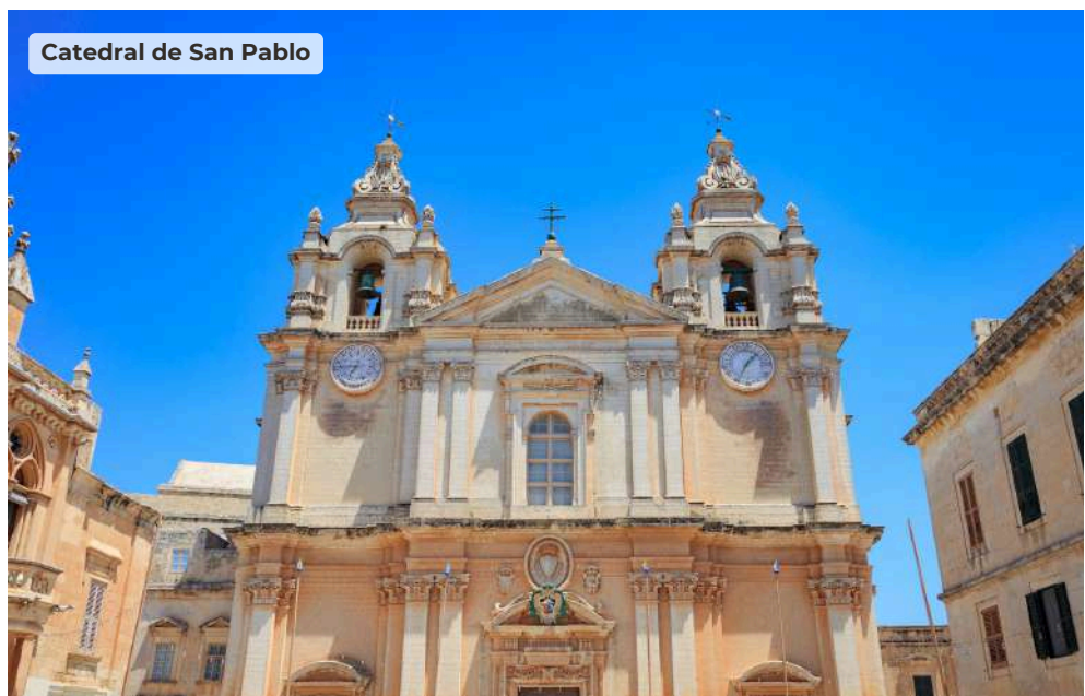
Catedral de San Pablo