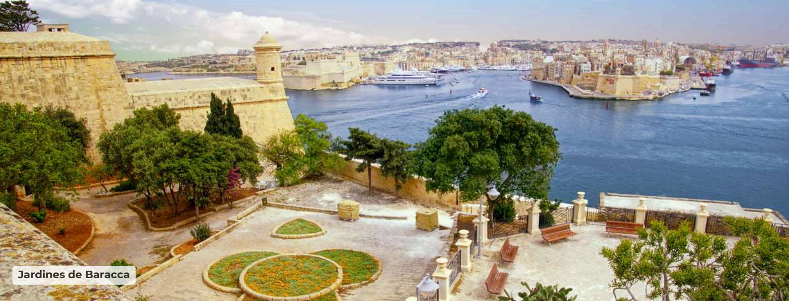
Jardines de Baracca