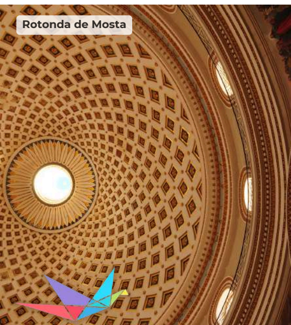
Rotonda de Mosta

Desayuno en el hotel y salida para nuestra excursión que empieza caminando por las vibrantes calles de Valletta, lo que le permitirá descubrir el encanto y la belleza de esta ciudad fortificada, construida por los Caballeros de San Juan en 1566. La orden de Caballeros reinó las islas durante 268 años dejando un legado cultural único, del cual Valletta es el principal ejemplo. Visitamos primeramente los Jardines de Baracca Superior desde donde admiramos la panorámica del Gran Puerto. Seguimos hacia la concatedral de San Juan y el Oratorio que contiene las pinturas de Caravaggio. Esta concatedral tiene los suelos de mármol más excepcionales que existen en el mundo. Bajando por la calle República pasamos por delante del Palacio de los Grandes Maestres y la plaza San Jorge, recientemente restaurada, antes de concluir con el espectáculo audiovisual de Malta Experience, en el cual conoceremos un poco más de la historia de Malta a través de los siglos y que aquí podremos revivir. Resto del día libre; alojamiento en el hotel.