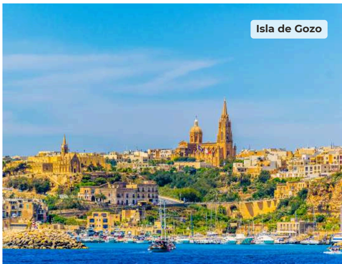
Isla de Gozo